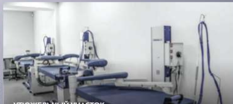
УСТРОЙСТВО ДЛЯ ИСПЫТАНИЙ