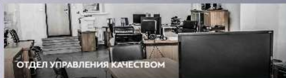
ОТДЕЛ УПРАВЛЕНИЯ КАЧЕСТВОМ