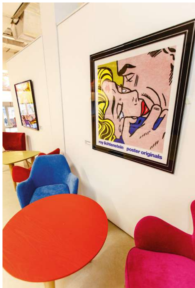
Зал поп-арта.