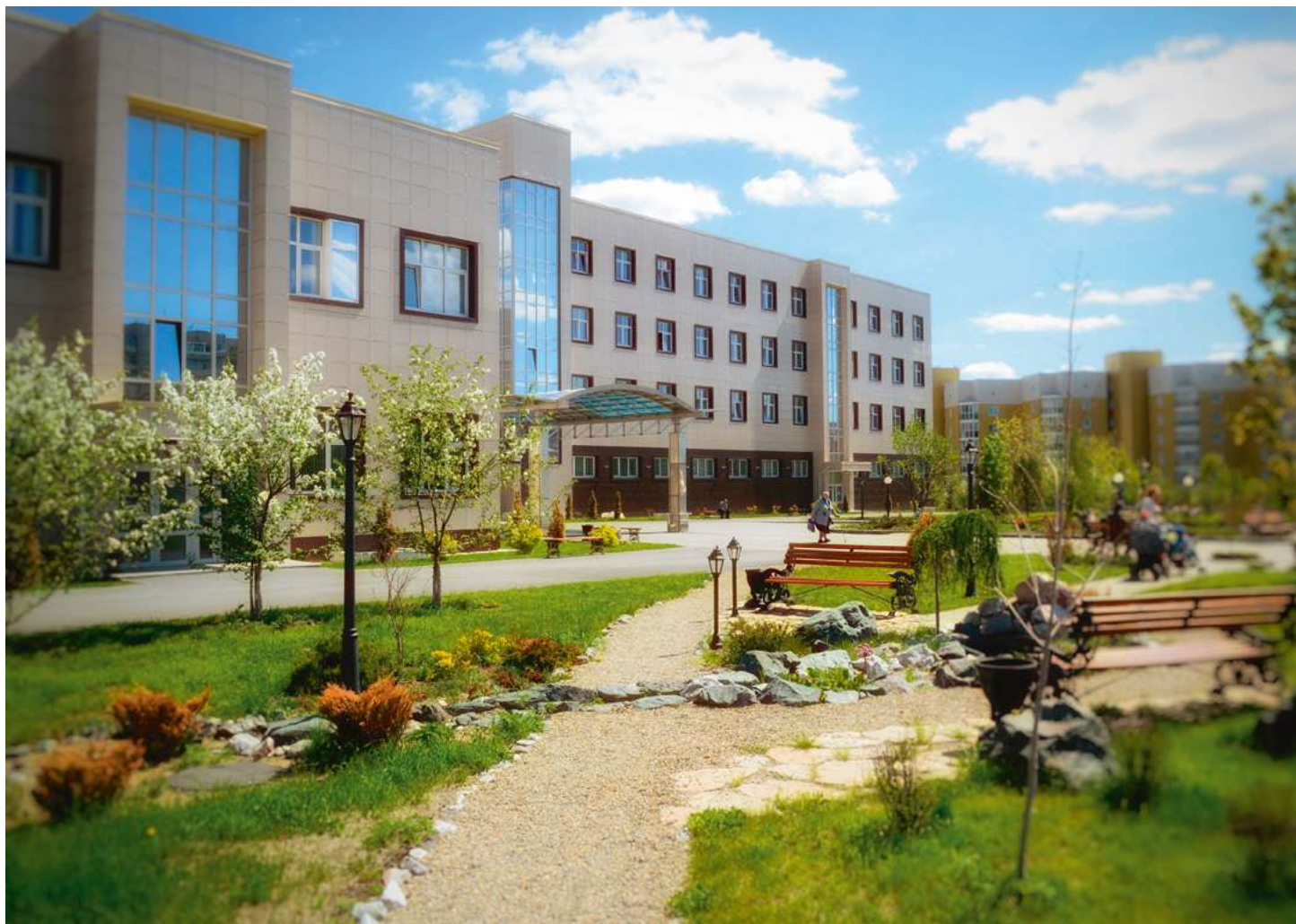
■ На фото главный корпус Уральского клинического лечебно-реабилитационного центра в Нижнем Тагиле